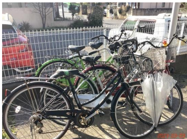
共用部状況・放置自転車・(20)整理後