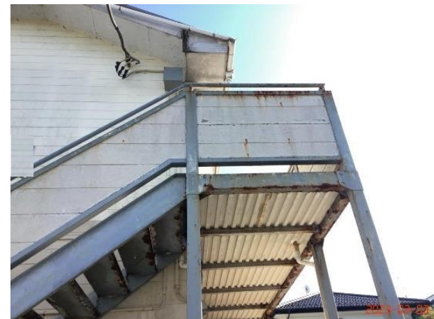
建物本体・廊下・(3)天井1F