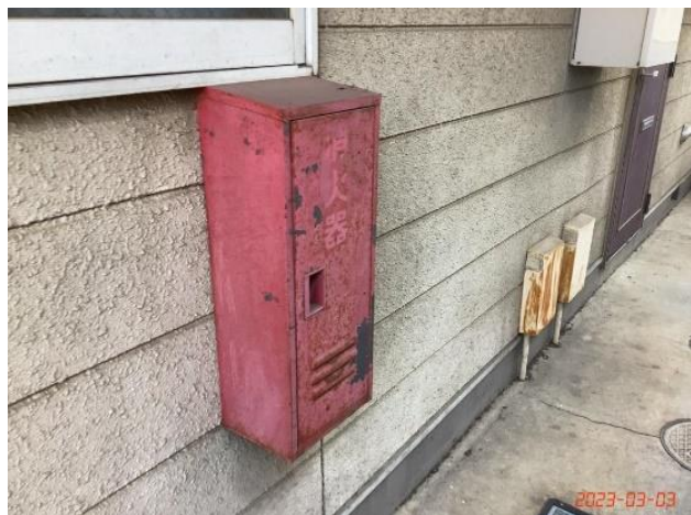
建物付帯設備・消火器収納箱(16)サビ状況