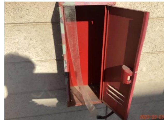
建物付帯設備・消火器(15)103、202横消火器なし