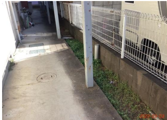
建物本体・廊下・(10)苔汚れ