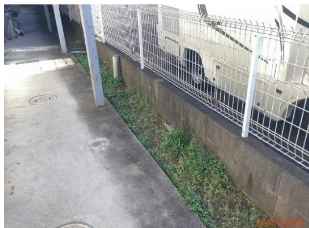
共用部状況・庭(除草含む)・(22)雑草状況