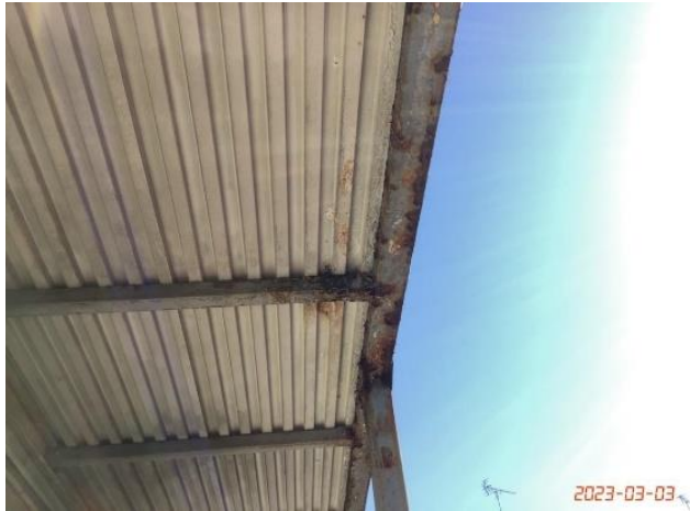
建物本体・廊下・(7)天井