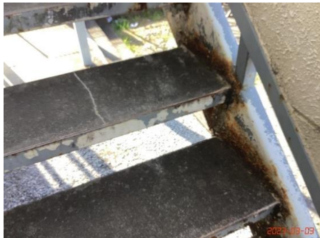
共用部状況・階段・(17)鉄部サビ・コケ汚れ