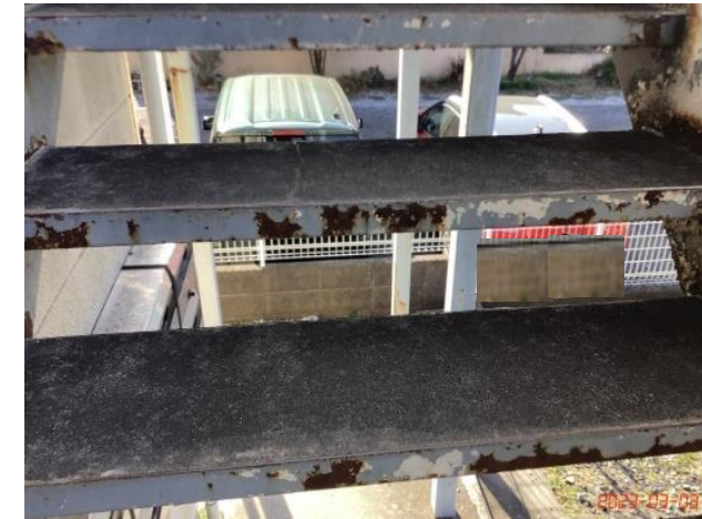
共用部状況・階段・(18)鉄部サビ・コケ汚れ