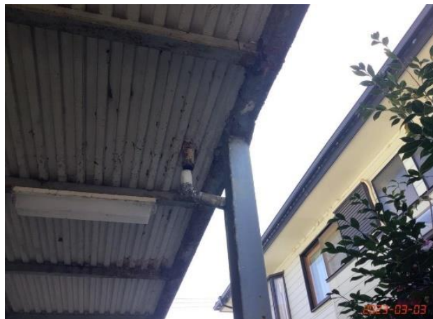
建物本体・廊下・(2)1F