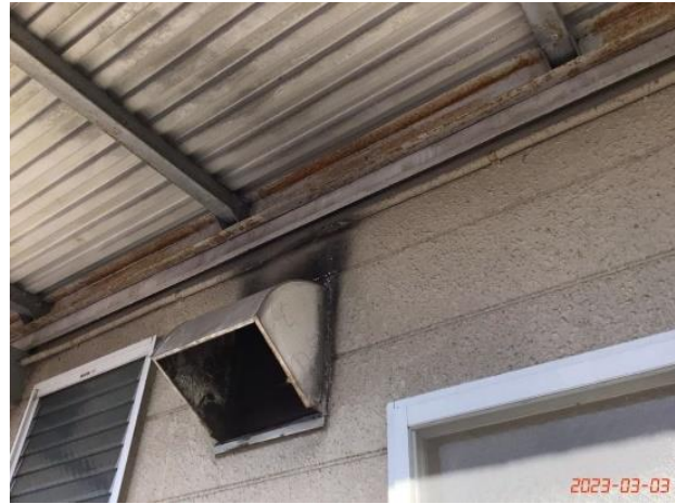
建物本体・廊下・(8)換気口付近汚れ