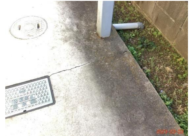
建物本体・廊下・(9)床面ヒビ割れ