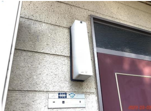
建物付帯設備・共用灯・(11)カバーネジ紛失103横