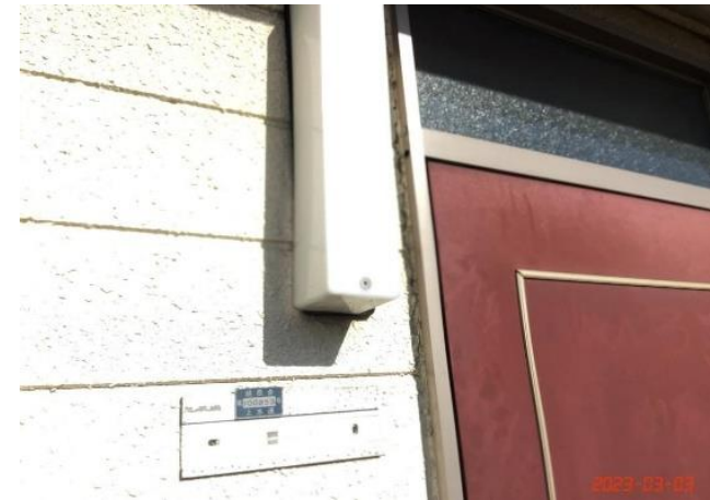
建物付帯設備・共用灯・(12)カバーネジ紛失202横