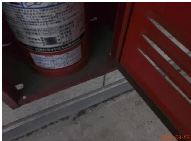
建物付帯設備・消火器(14)