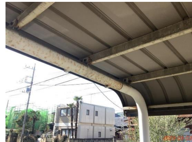
共用部状況・駐輪場・(21)鉄部サビ