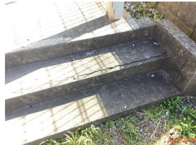
建物本体・廊下・(6)