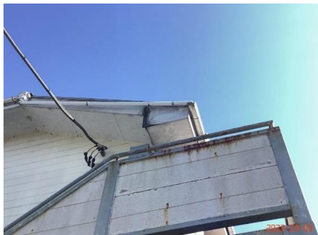
建物本体・破風・(4)