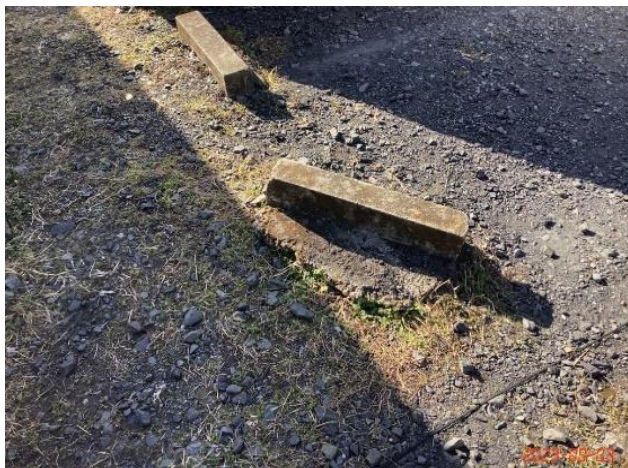
建物付帯設備・駐車場・(13)車止め