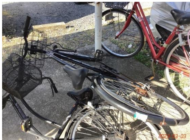
共用部状況・放置自転車・(19)低利用自転車