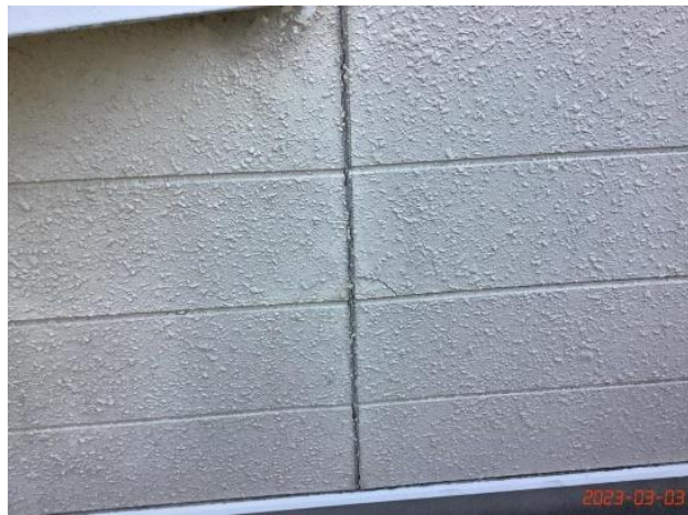
建物本体・外壁・(5)ヒビ割れコーキング劣化