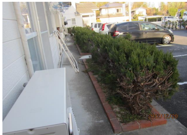
共用部状況・植栽