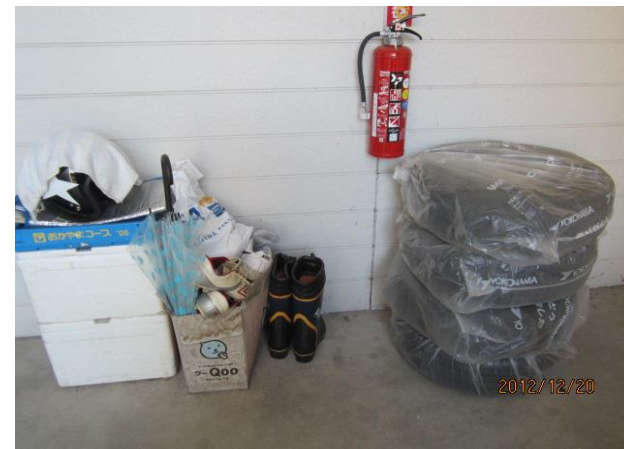
建物本体・居室踊場私物有り