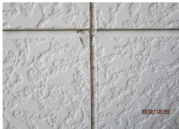
建物本体・コーキング・ヒビ、縮み