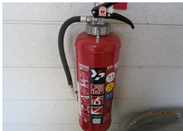
建物付帯設備・消火器